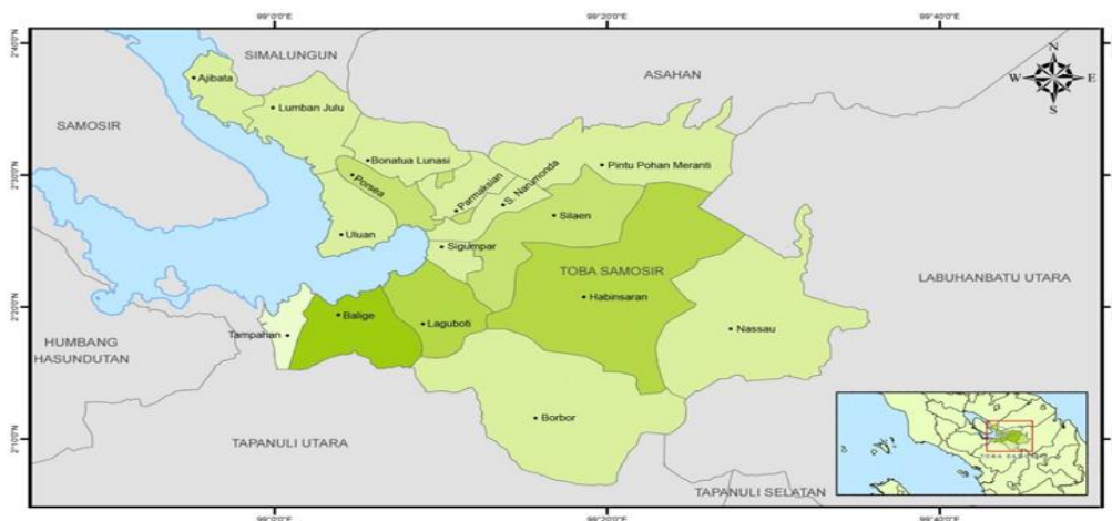
Gambar 1.1 Peta Wilayah Kabupaten Toba

Berdasarkan letak geografisnya, Kabupaten Toba berada diantara lima kabupaten yaitu di sebelah utara berbatasan dengan Kabupaten Simalungun, sebelah timur berbatasan dengan Kabupaten Labuhan Batu dan Asahan, sebelah Selatan berbatasan dengan Kabupaten Tapanuli Utara dan disebelah barat berbatasan dengan Kabupaten Samosir. Sementara jika dilihat berdasarkan kondisi geografisnya, Kabupaten Toba terletak di 2°03' – 2°40' LU dan 98°56' – 99°40'BT dan berada pada ketinggian 900-2.200 mdpl dan tergolong iklim basah dimana suhunya berkisar antara 17°C – 29°C. Selama tahun 2019, curah hujan tertinggi terjadi di Bulan November sebesar 292 mm dengan jumlah hari hujan 22 hari sedangkan curah hujan terendah terjadi di Bulan Juli sebesar 40 mm dengan 8 hari hujan. (Sumber: BPS, Publikasi Kabupaten Toba Dalam Angka 2019).